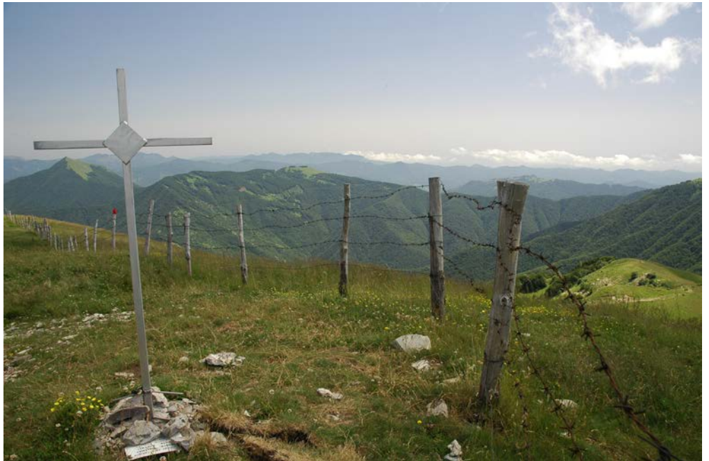
La piccola croce in cima al Legnà

In verità esiste una stradina prima cementata e poi asfaltata che si ricongiunge all'itinerario sotto descritto appena a monte del paese: la stradina ha origine sul lato opposto di quella che entra nel paese e consente di risparmiare una cinquantina di metri di dislivello; si consi-